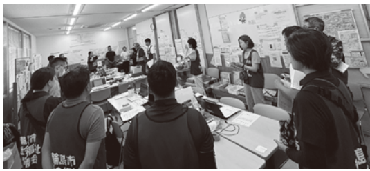
(輪島市社会福祉協議会での様子)

1月に発生した能登半島地震でも、これまで各地で起こった大きな災害と同様に、災害ボランティアセンターが被災地の社会福祉協議会によって設置されています。