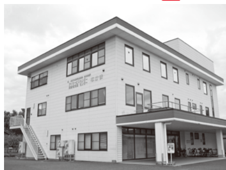
鳥羽中駅徒歩1分 鳥羽事業所「なかま」

員一人ひとり真心をもって笑顔で業務にあたっています。夏休み等の長期休暇中には、外出行事やおやつ作り、季節に合わせた行事なども取り入れています。