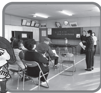
【独り歩き高齢者声かけ伝達訓練】