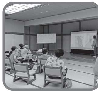
【認知症の人と家族の集い】