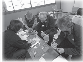
折り紙ボランティア