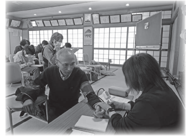
巡回時の血圧測定